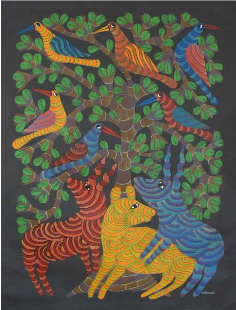
NARMADA SINGH TEKAM - L'ARBRE SACRÉ - ACRYLIQUE SUR TOILE - 118X90CM