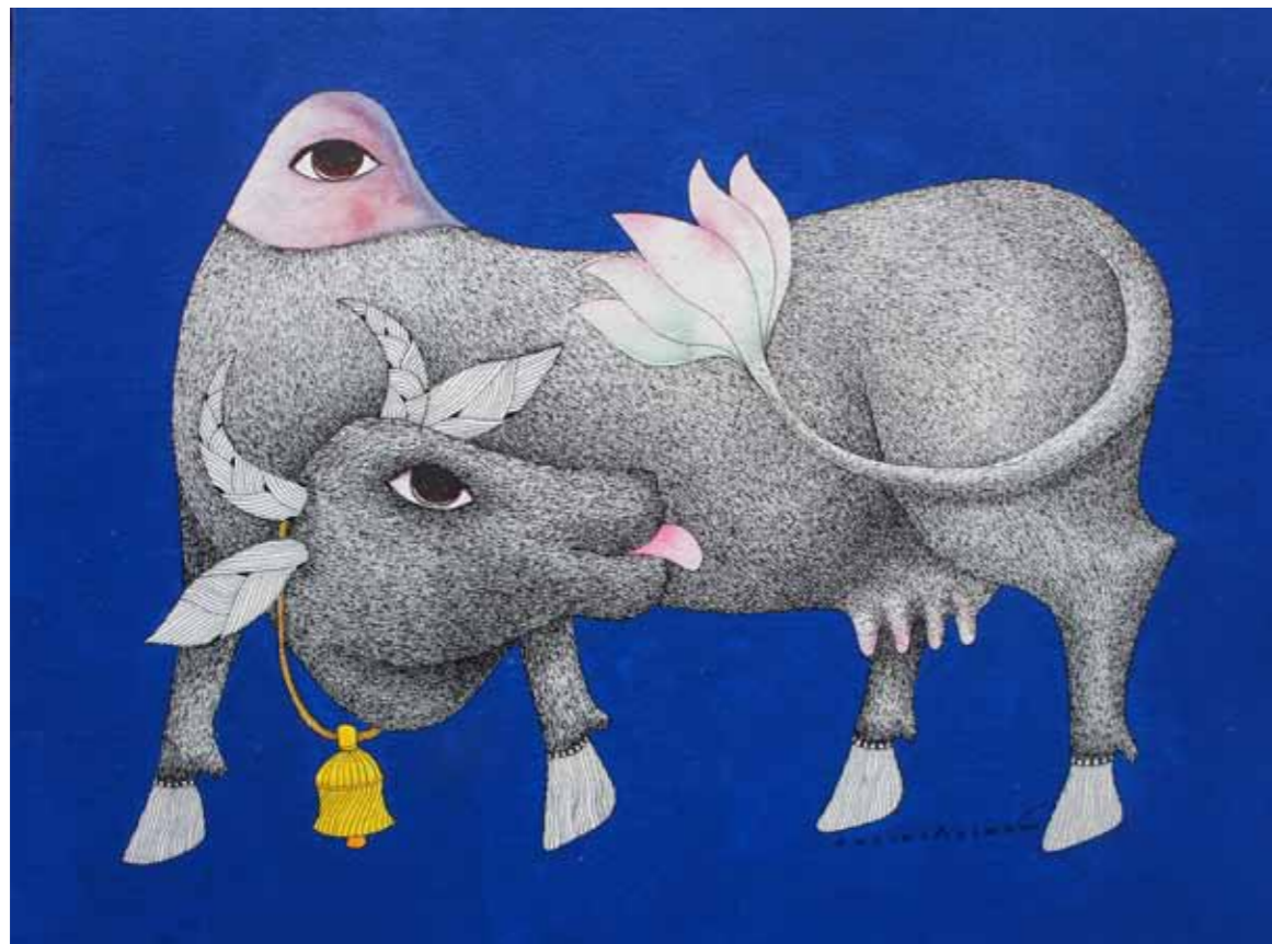
VENKAT SHYAM - KAMDHENU - 90x67CM - 2011